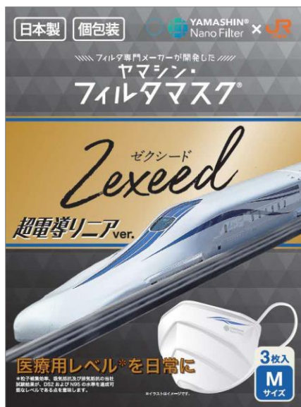
パッケージイメージ